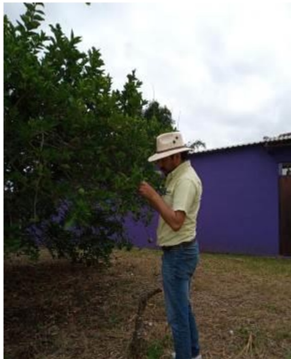
Figura 3. Exploración para detección de síntomas de Leprosis

c) Control químico. Respecto al control químico esta actividad se llevó a cabo en 5,126.75 ha; 4,804.25 ha correspondientes a la AMEFI 01- Fco. Z. en la Región Norte y en 322.5 ha correspondientes a la AMEFI 03-Acateno en la Región Nororiental; Esta actividad se realizó a fin de disminuir las poblaciones de diaforina y evitar daños a la brotación de cítricos de este periodo vegetativo.