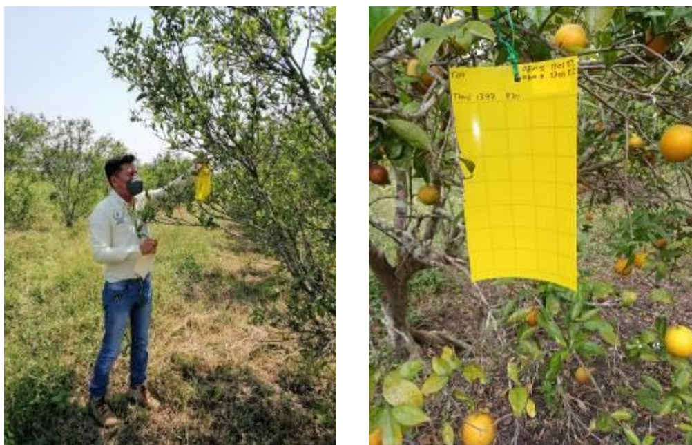
Figura 2. Trampas establecidas y revisadas para el monitoreo del PAC.

Dichas trampas se revisan cada catorce días y la información se analiza en el Sistema de Monitoreo de Diaphorina (SIMDIA), lo anterior para la toma de decisiones de acuerdo al umbral de acción determinado por el Grupo Técnico del Estado. El total de trampas registradas es de 3,600 de las cuales fueron revisadas 3580 y 20 no revisadas porque no tener acceso al predio.