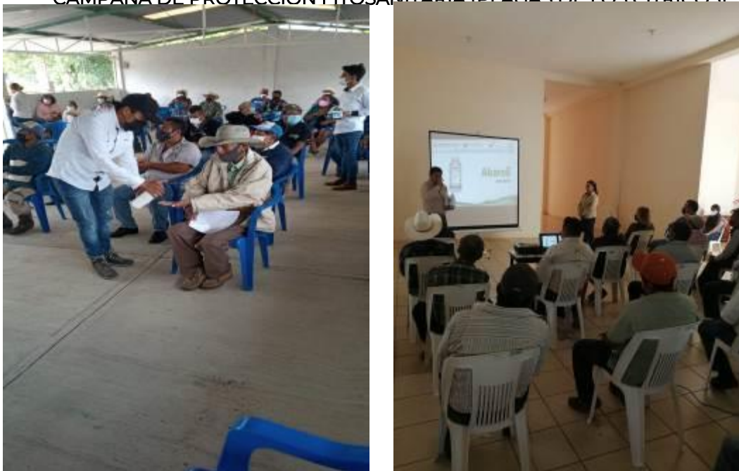
Figura 5. Talleres participativos a productores sobre síntomas de plagas reglamentadas de los cítricos

e) Mapeo. Se llevo a cabo la formación y estandarización de 30.54 hectáreas de cítricos correspondiente a 15 polígonos ubicados en los Municipios Venustiano Carranza y Pantepec correspondiente a la Región Sierra Norte; Acateno y Ayototxco de Guerrero correspondientes a la Región Sierra Nororiental.