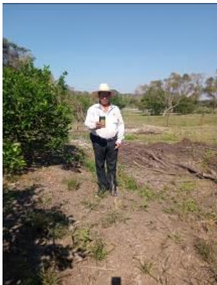
Figura 6. Formación y estandarización de polígonos en huertas de cítricos con la aplicación móvil SIAFEPOL.

e) Mapeo. Se llevo a cabo la formación y estandarización de 30.54 hectáreas de cítricos correspondiente a 15 polígonos ubicados en los Municipios Venustiano Carranza y Pantepec correspondiente a la Región Sierra Norte; Acateno y Ayototxco de Guerrero correspondientes a la Región Sierra Nororiental.