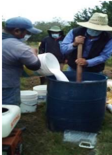
Figura 4. Control Regional del Psílido Asiático de los Cítricos en Francisco Z. Mena y Acateno

d) Entrenamiento. Con el propósito de difundir la estrategia operativa de la Campaña, así como la sensibilización hacia los productores sobre la importancia de las enfermedades y adopción de las acciones mediante el establecimiento de AMEFIs, se realizaron 6 Talleres Participativos; 1 en Francisco Z. Mena y 1 en Pantepec Municipios correspondientes a la Región Sierra Norte; 2 en Acateno, 1 en Hueytamalco y 1 en Jonotla Municipios correspondientes a la Región Sierra Nororiental. Con esta acción se benefició un total de 143 productores.